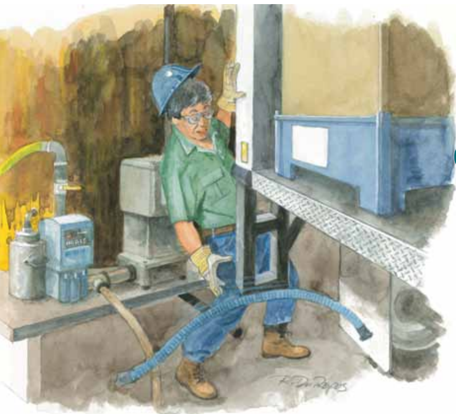
Illustration : Ronald DuRepos

Un travailleur est écrasé et meurt des suites de ses blessures.