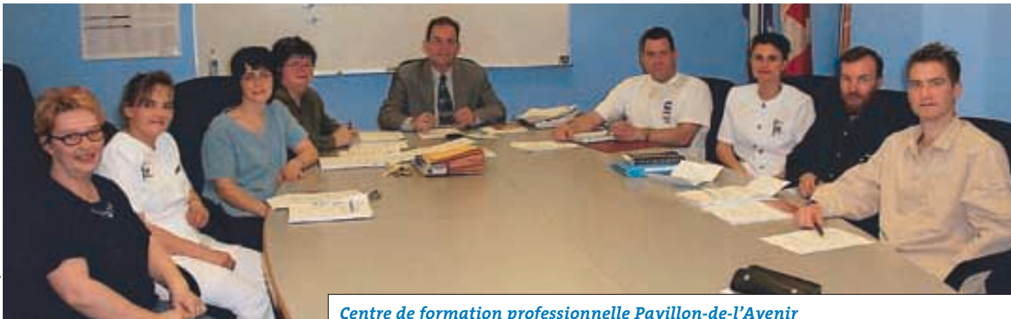
Centre de formation professionnelle Pavillon-de-l'Avenir