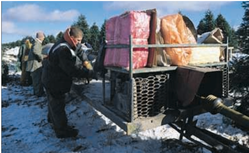
L'emballeuse vue de dos. On voit bien la prise de force et le grillage protégeant l'accès au treuil. Ce dernier est muni d'un dispositif sensible d'arrêt d'urgence.

Résultat de cette judicieuse campagne de prévention? « En visitant les producteurs, au cours de l'automne 2002, nous avons constaté des correctifs dans plusieurs cas, précise M. Zuchoski. Il reste encore des emballeuses à corriger et c'est pourquoi nous prévoyons refaire une tournée au début de chaque automne. » Le père Noël est sûrement content de voir des inspecteurs dans le décor... ○