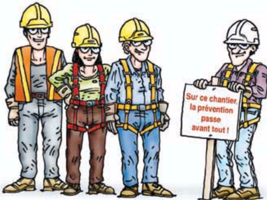
Illustration : Pierre Berthiaume