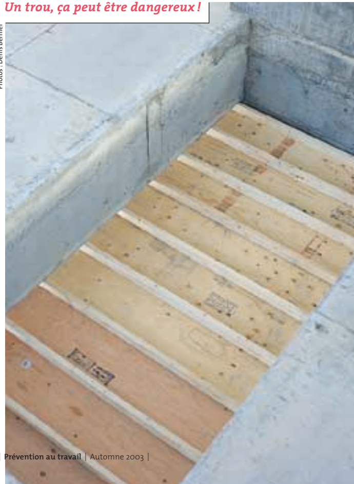
Un trou, ça peut être dangereux !