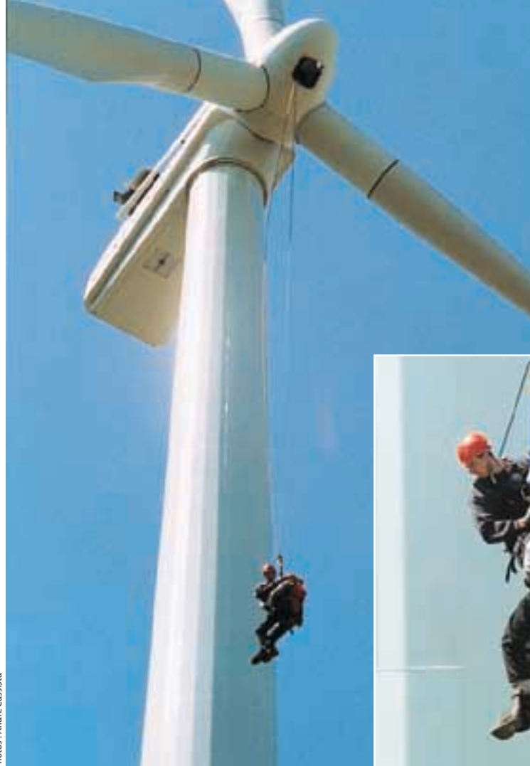
Neg Micon Canada

À Cap-Chat, depuis la route qui longe le golfe du Saint-Laurent, on peut voir sur les crêtes les éoliennes battre lentement des bras. La distance est trompeuse. En effet, même s'ils ressemblent aux « vire-vent » de notre enfance fichés sur une motte de gazon, les 133 moulins modernes installés par l'entreprise Neg Micon Canada atteignent une respectable hauteur de 55 mètres au moyeu. Et cette hauteur est encore plus impressionnante vue du faite des tours!