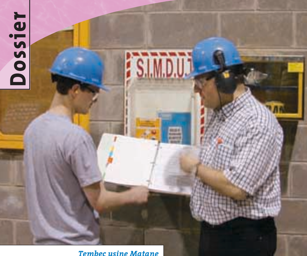
Tembec usine Matane